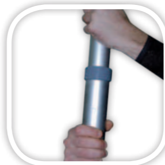
Blocage par autoserrage et par cliquet; permet un réglage de 3 à 6 m.