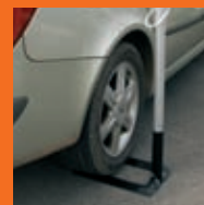
Pied Autocal en 2 parties. À caler sous la roue d'une voiture.