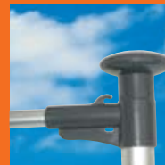
Pommeau rotatif équipé d'une puissance de 1,20 m maxi.