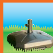
Pied lestable (50 litres). Idéal sur sols durs (parking, trottoirs...)