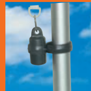
Contrepoids assurant la tension de la bannière.