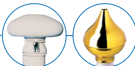
Pommeaux blanc ou doré