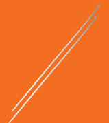
Collier collson x2