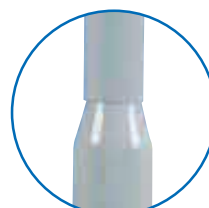
Mât en 2 parties facilitant le transport