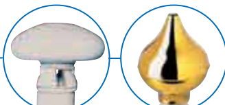
Pommeaux blanc ou doré